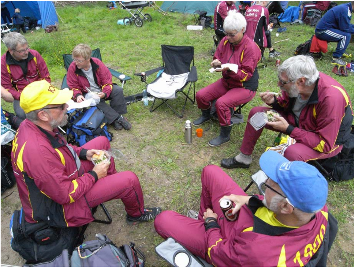
Eftersnak og lidt at spise - Vestjysk 2-dages

Aarhus 1900's farver har været rigt repræsenteret i de mange forskellige og spændende løb i første halvdel af sæsonen 2013.