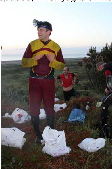
Billede Per Lind

Trods min træthed var jeg glad for at vi kun holdt en relativ kort pause. Jeg har nemlig tidligere måttet udgå fordi jeg ikke kunne få varmen igen efter at have holdt en længere spisepause, hvor jeg blev kold.