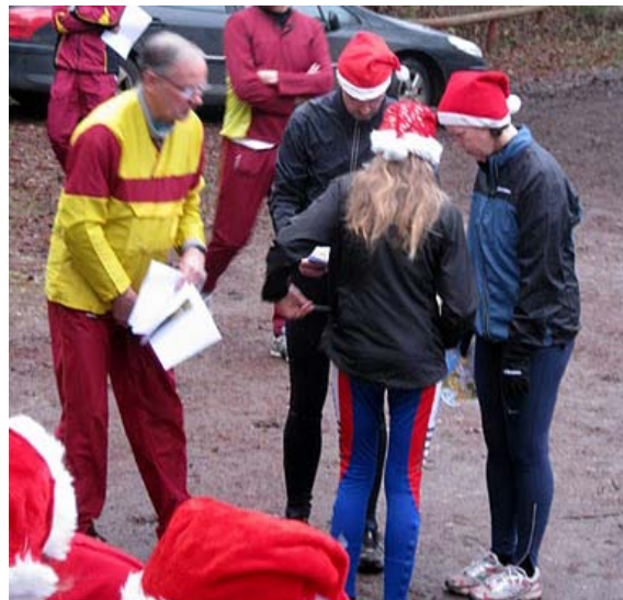
Skumle planer lægges på vinderholdet?