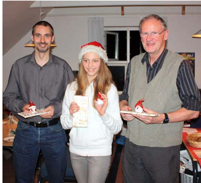
Kan man aflure en lille, stille glæde?