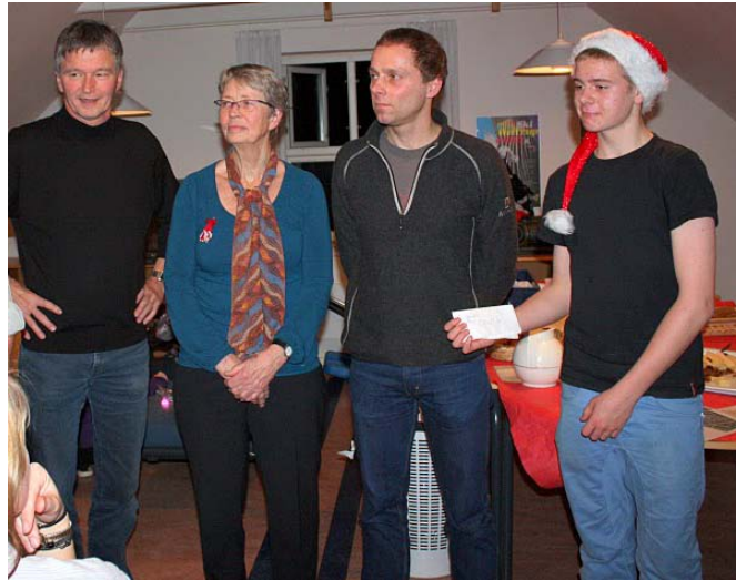
Spændte løbere skuer frem mod 2010 mod nye horisonter