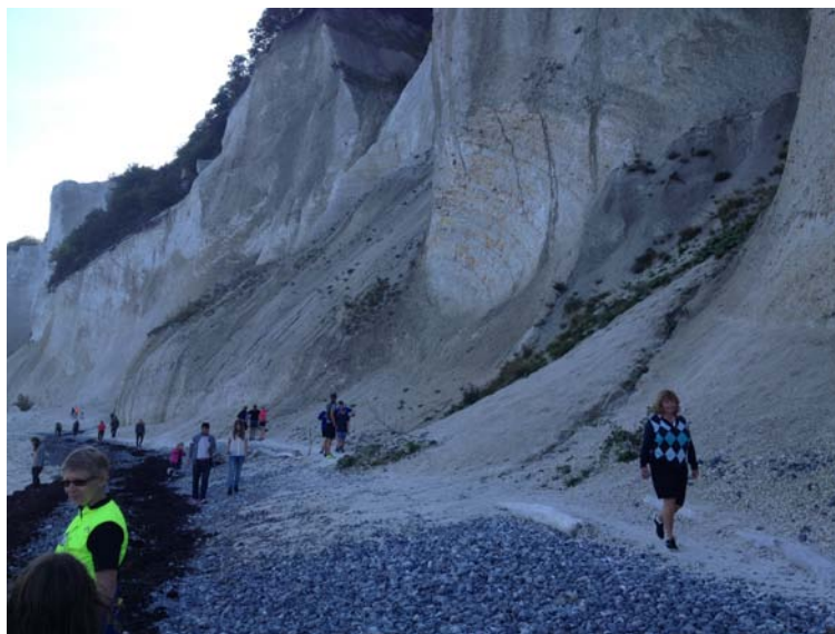
O-løbere får åbenbart aldrig nok.

Efter en begivenhedsrig dag vendte vi trætte og SULTNE tilbage til vandrehjemmet, og aldrig har vi set så mange karbonader blive fortæret. Det var en hyggelig aften med øl og vin og der blev diskuteret kortvalg, bommerter og strategi til den næste dag.