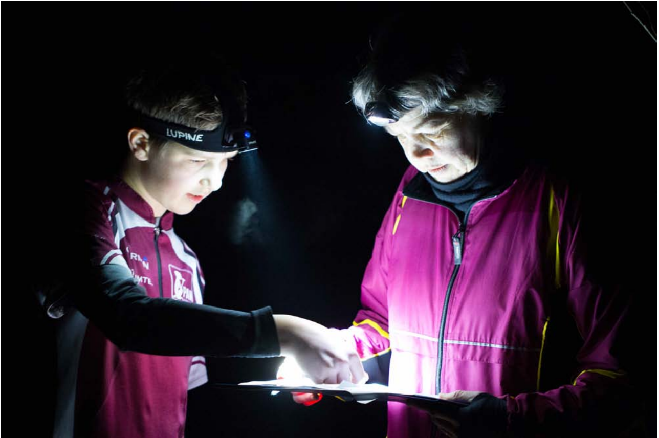
Randi krydser af ved starten

Aarhus 1900 arrangerede i år det første af i alt 4 natugler, den 5. marts med Vibeke Edsen som stævneleder.