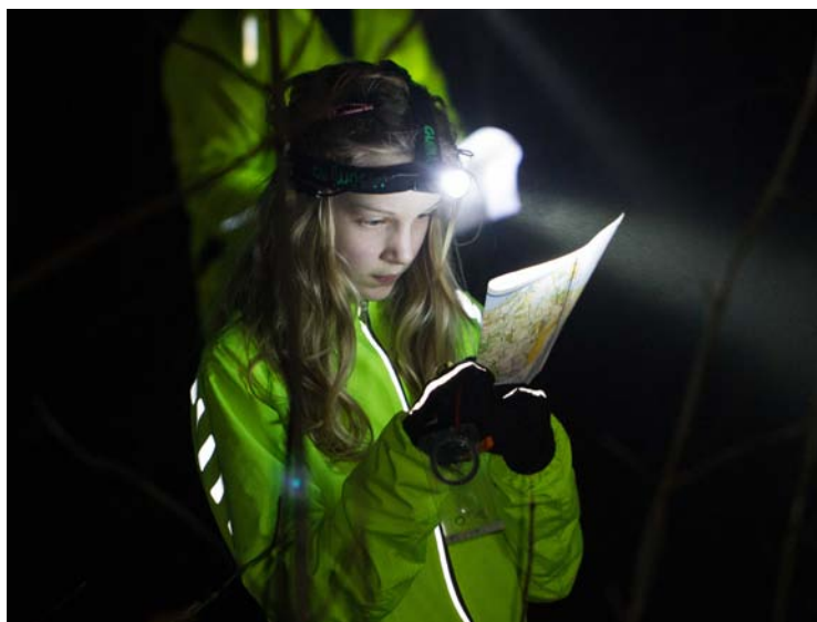
Koncentration i mørket