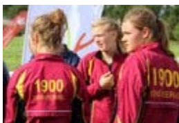
Bekymrede piger, fik deres fortjente medalje