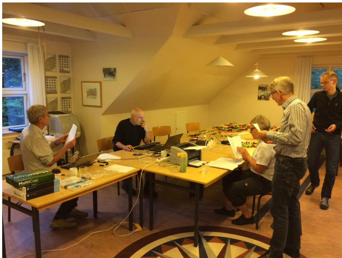
Der tænkes mange tanker forud for et DM med de mange funktioner.