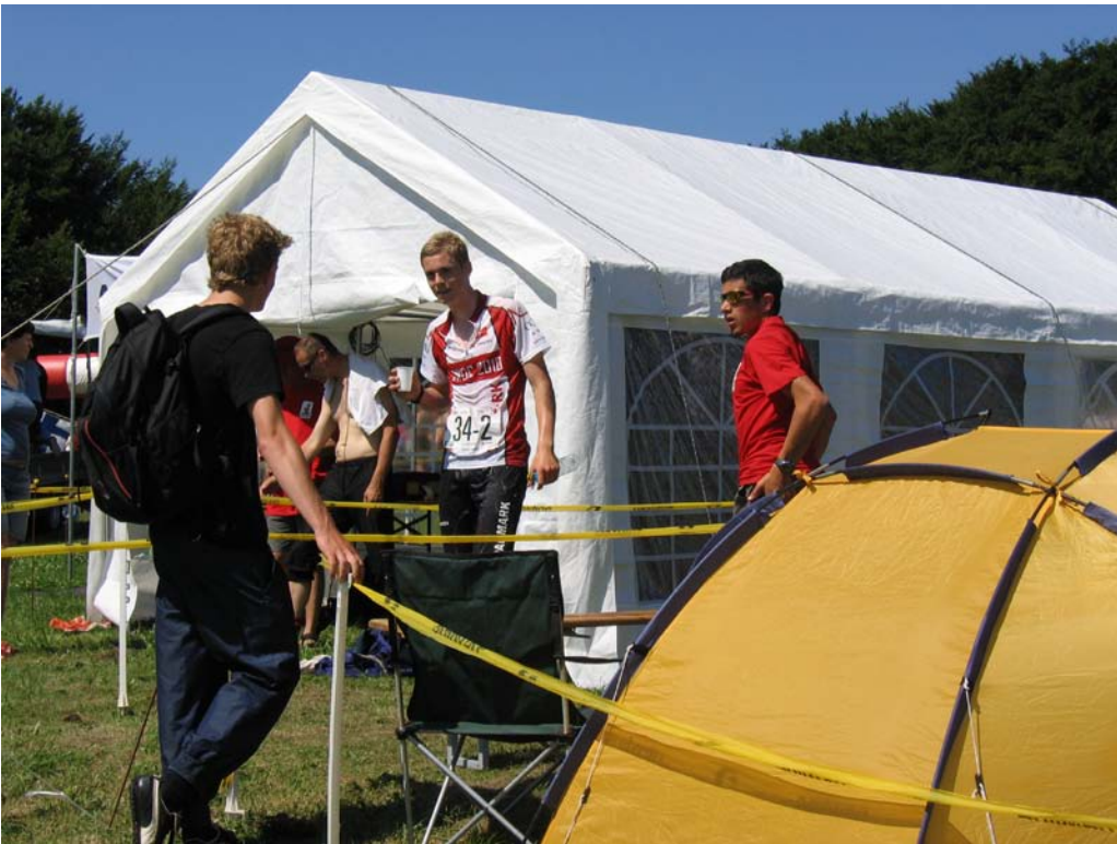
Der skete meget andet den dag: