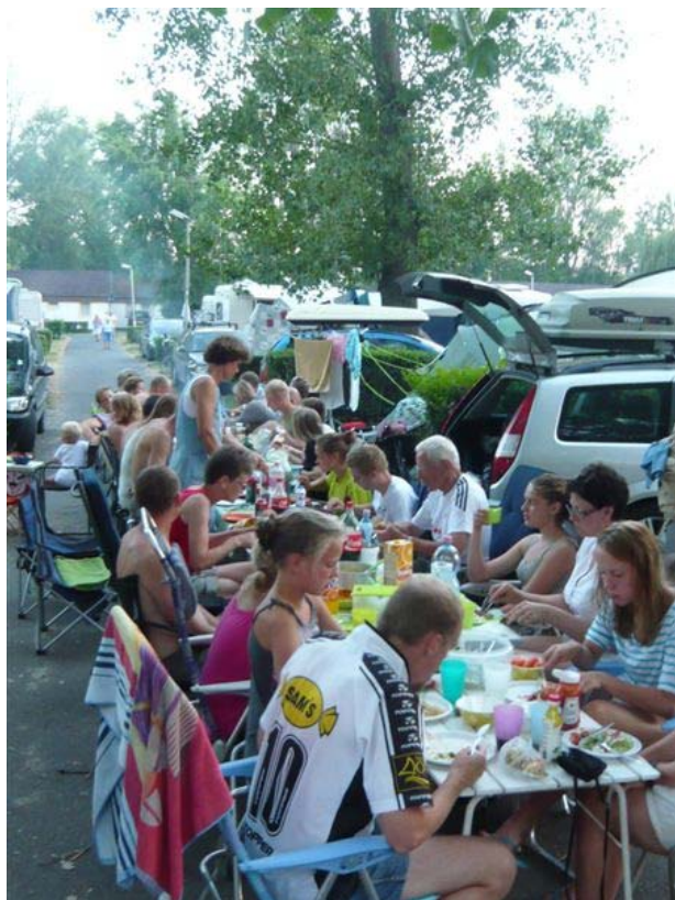
Fællespisning på campingpladsen med 31 o-løbere til bords