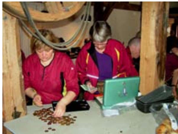
Sammenrend og sammentælling i kiosken