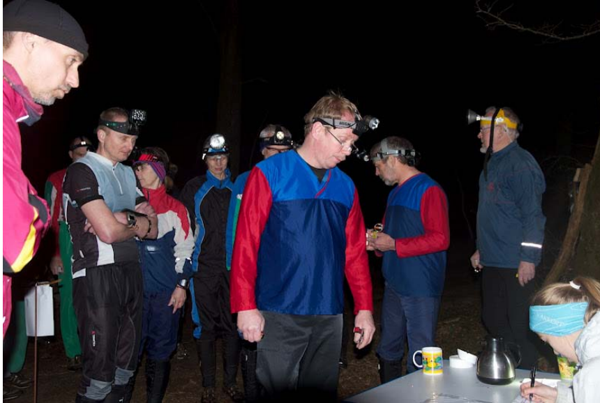
Natugler gør sig klar

For anden gang var jeg stævneleder på en af de fire etaper af Natuglen. Denne gang blev stævnet afviklet i skovene omkring Bidstrup Gods, og det bød på udfordringer, uforudsete begivenheder og fanstastisk stemning.