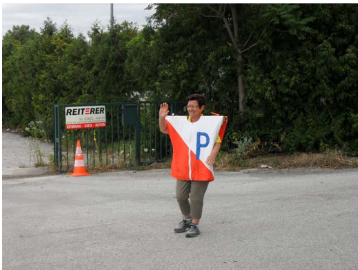
o-løbere er iderige og humoristiske, her Østrig 2011

Bankkonto: Reg.nr. 6180 konto 0005603056