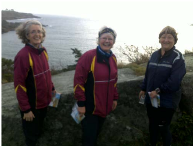
O-løb byder på mange oplevelser udover løbet, her Norge 2011

(Pakken træder i stedet for tanken om gratis divisionsmatcher).