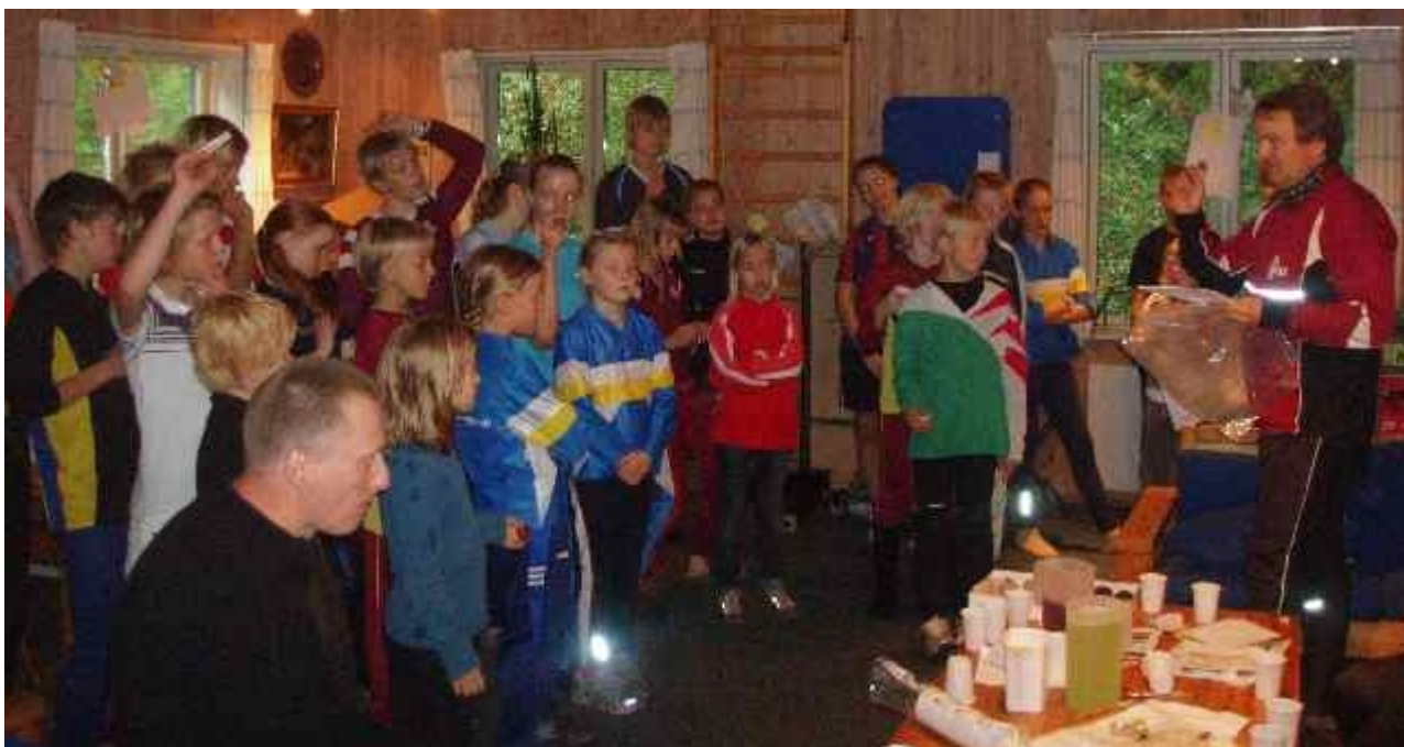
Hærfører Majestix instruerer tropperne, trylledrikken er klar

Men der var stribevis af heroiske præstationer, og Nordkredsens Venner belønnede i år alle med en flot rød løbetrøje.