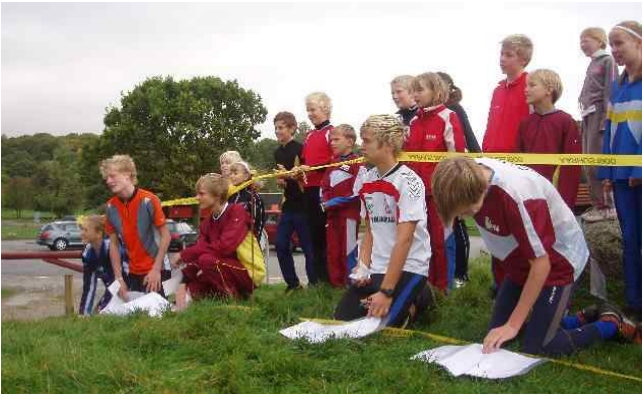
Spænding før start.

Mens de sidste vildsvineburgere blev fortæret og skyllet ned med mere trylledrik, oplæste Talfix dagens resultater af gallernes indbyrdes konkurrencer, der var udregnet efter et snedigt pointsystem i alle discipliner og hængt til tørre på klemmer og snore.