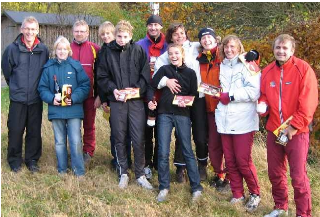
Et udsnit af deltagerne og de mange præmier.

Alt i alt en herlig efterårsdag i Rold Skov.