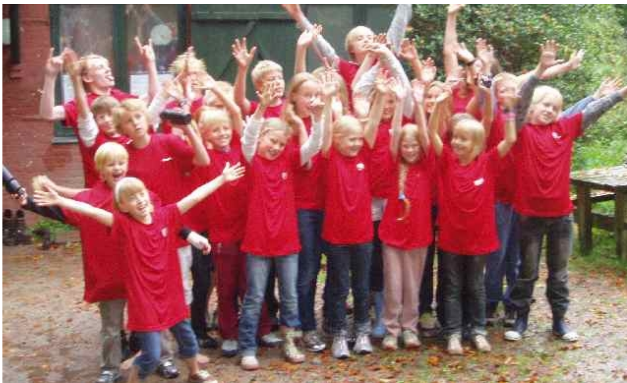
Gallerhæren iført sin flotte præmie fra Nordkredsens Venner