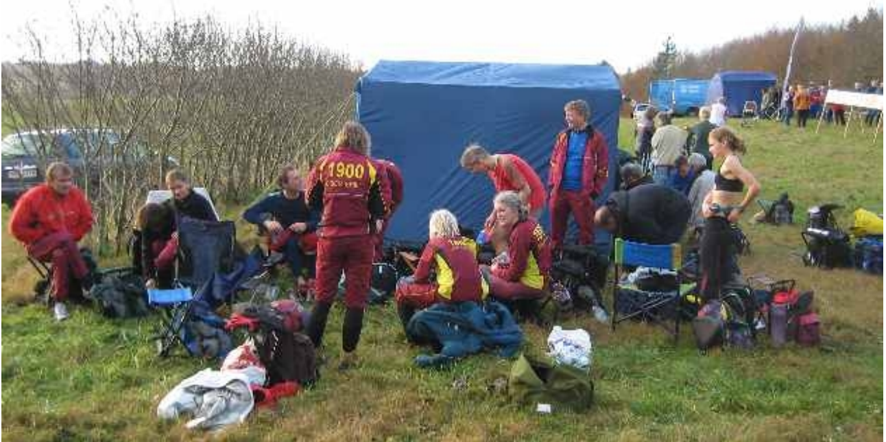
Samling på stævnepladsen