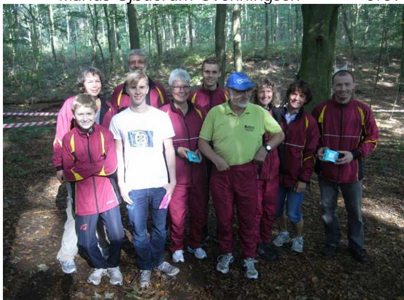
Klubmestrene 2011 en smuk efterårsdag.