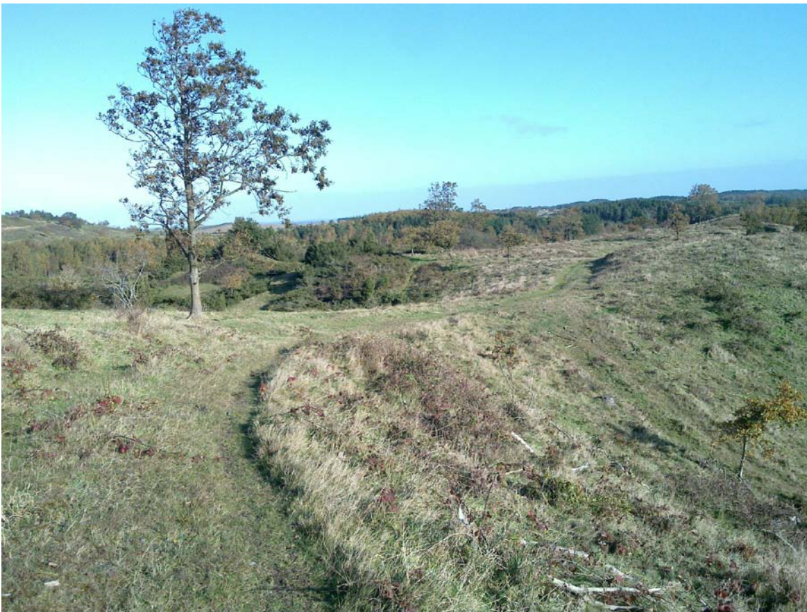
Mols Bjerge et terræn, vi kan glæde os til.

Vore udsendte orienteringsløbere med hang til korttegning er på farten for at sikre et udfordrende og smukt område til os alle. Et stort stykke arbejde er igang, nok større og mere tidkrævende, end de fleste aner, for slet ikke at tale om den tekniske kunnen, der også er nødvendig.