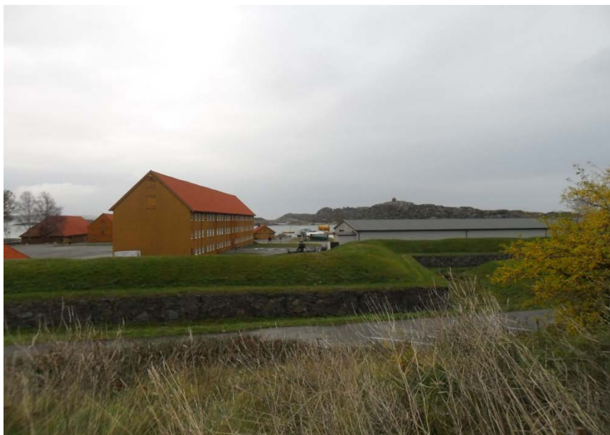
Frederiksvern Verft, ved politiskolen.