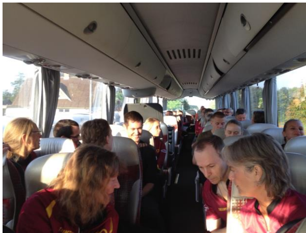
Figur 1 Således er billedet før løbet - alle følger interesseret med i om der kunne være gode fif. Af Birgit Rasmussen

En busfuld entusiastiske orienteringsløbere blev samlet op forskellige steder i Aarhus med start i Harlev, og hvor sidste opsamlingssted blev ved Hadsten motorvejstilkørsel.